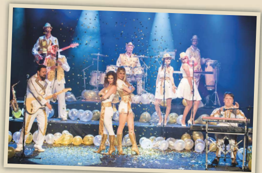
ABBA world Revival